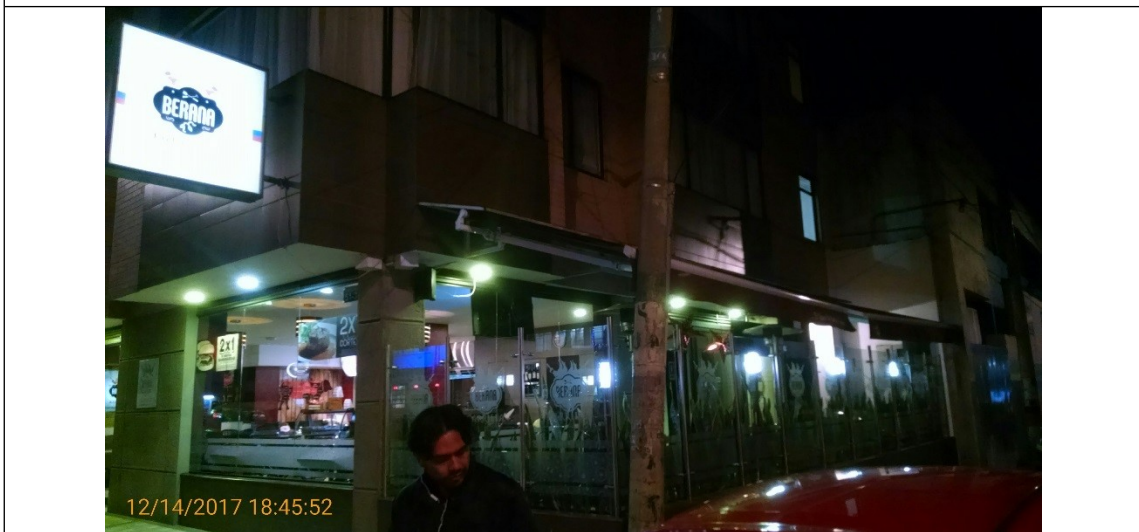
Fotografía No. 2 Vista de los elementos tipo aviso en fachada del establecimiento de comercio BERANA PARRILLA, ubicado en la Carrera 27 # 51 - 33 sentido NORTE - SUR, el cual se encuentra instalado en la fachada del establecimiento, además se evidencia publicidad en ventanas.