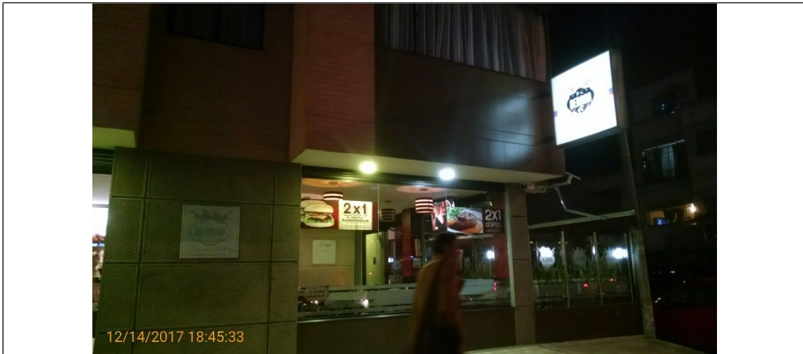
Fotografía No. 1 Vista de los elementos tipo aviso en fachada del establecimiento de comercio BERANA PARRILLA, ubicado en la Carrera 27 # 51 - 33 sentido SUR - NORTE, el cual se encuentra instalado en la fachada del establecimiento, además se evidencia publicidad en ventanas.